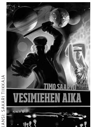
KANSI: SAKARI TIIRKKAJA